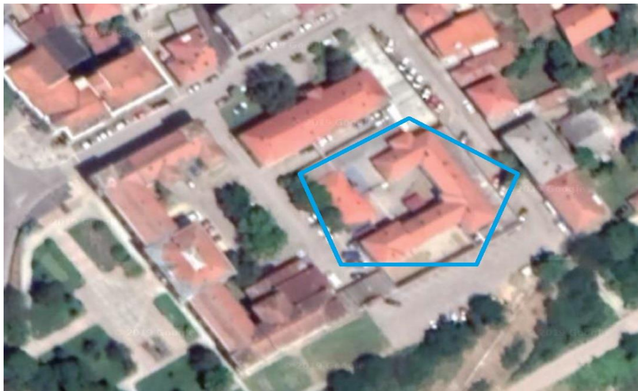
уоквирени објекат је Завод, мањи поред њега полиција, а већи општина