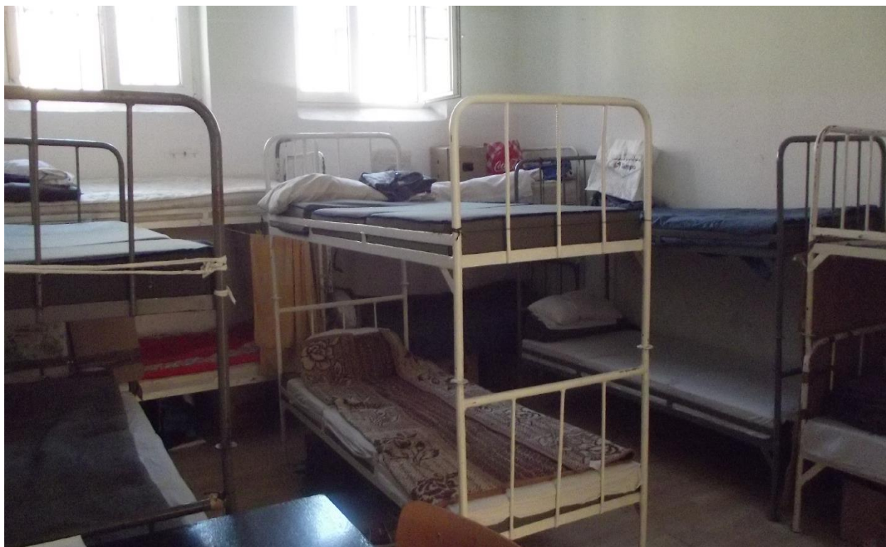
кревети и лежајеви у спаваоници полуотвореног одељења