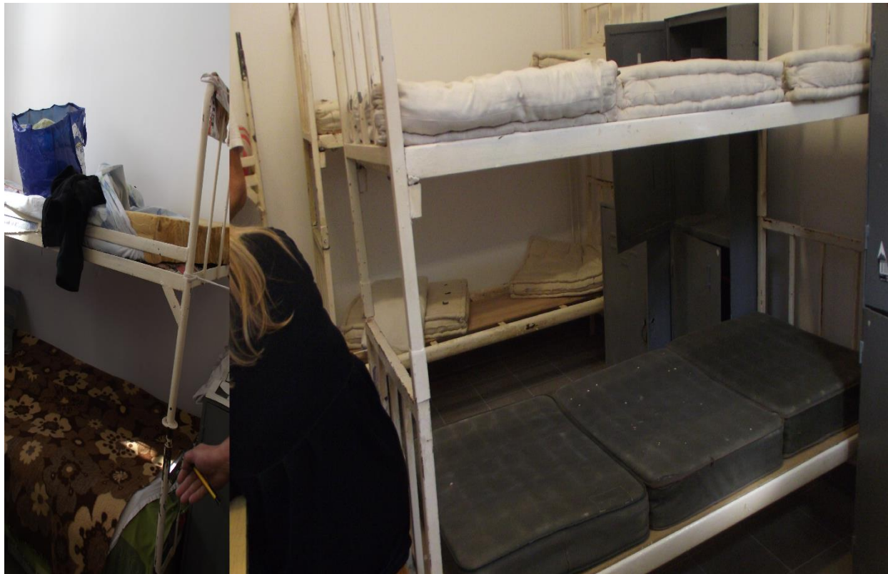
душеци у спаваоницама затвореног одељења

Постељина је деловала уредно, а лица лишена слободе су навела да добијају чисту два пута месечно. На лежајевима, уз пар изузетака, су постављени дотрајали душеци.