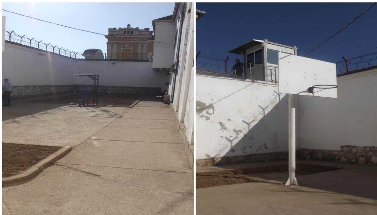
шеталиште затвореног одељења

У згради Завода постоји 1 шеталиште за осуђене разврстане у групу В и притворена лица. Шеталиште је бетонско. Овде се налази справа за згибове и пропадање и кош за кошарку. На шеталишту постоји и клупа за седење која је прекривена надстрешницом. Шетња лица лишених слободе траје два часа. Теретана у затвореном не постоји у Заводу.