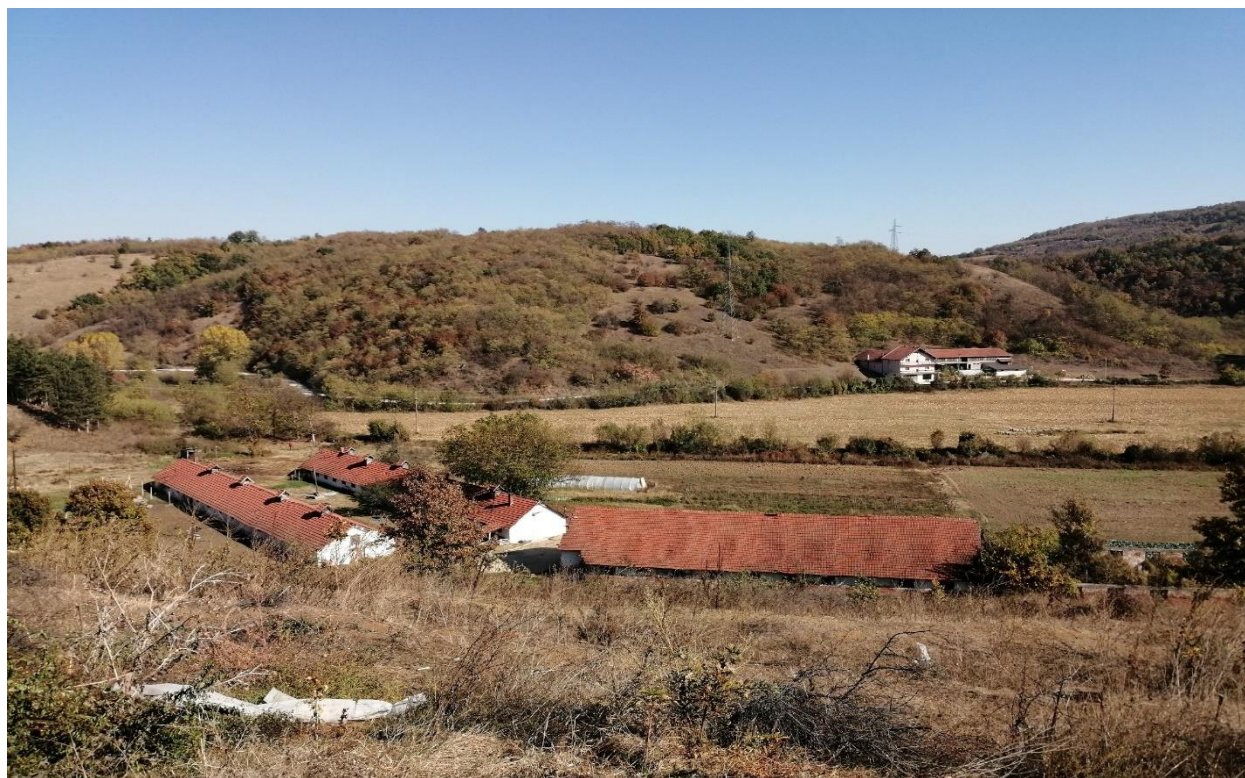
помоћни објекти у отвореном одељењу

Овде се налазе и помоћни, радни објекти за узгој различитих пољопривредних култура попут жита, кукуруза, поврћа и воћа, стоке – свиња и оваца, као и пашњак.