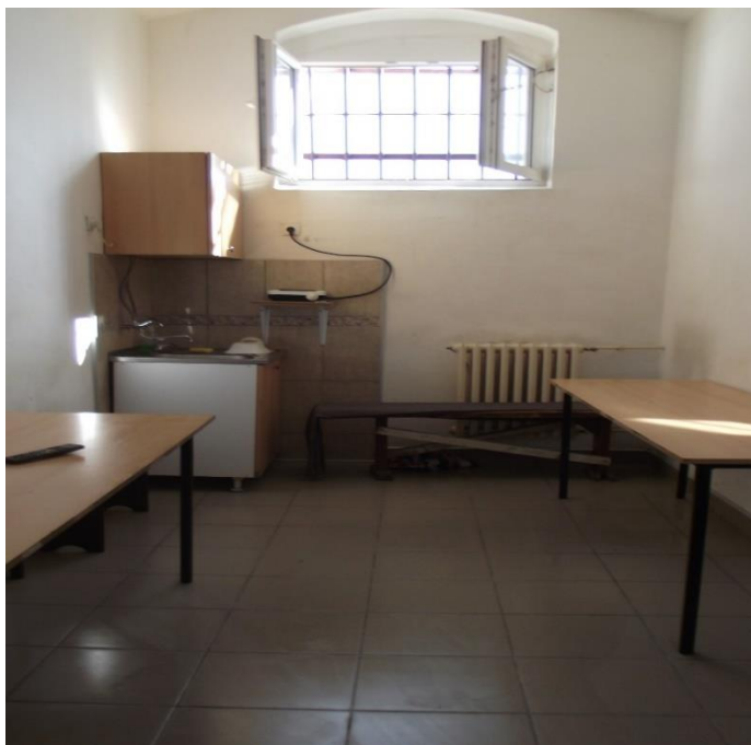
заједничка просторија за осуђене из затвореног одељења

Притвореници немају могућност коришћења заједничких просторија. 133