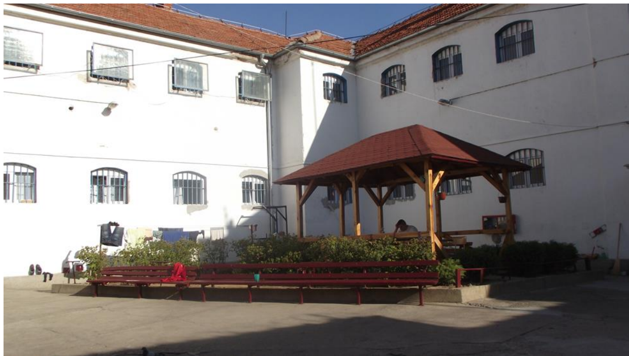
шеталиште полуотвореног одељења

Осуђени из полуотвореног одељења и прекршајно кажњени за шетњу на располагању имају пространо двориште Завода, док осуђени који се налазе на Економији Завода имају простор за боравак на свежем ваздуху испред објекта у којем су смештени. Оба простора су доступна осуђенима стално током њиховог слободног времена и у оба су постављене справе за вежбе.