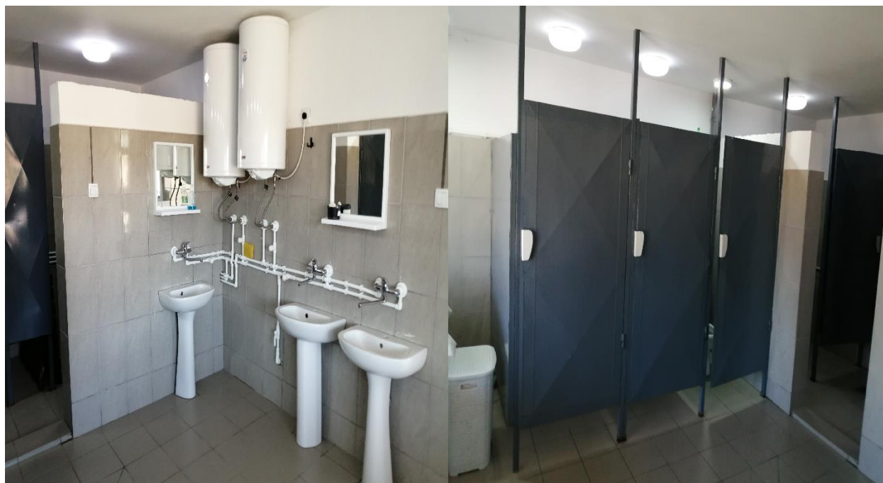
заједнички тоалет и купатило у отвореном одељењу - економији

У издвојеном делу Завода – Економији материјални услови смештаја су у одличном стању. Објекат за смештај се састоји од просторије за дневни боравак, спаваоница и заједничког тоалета.