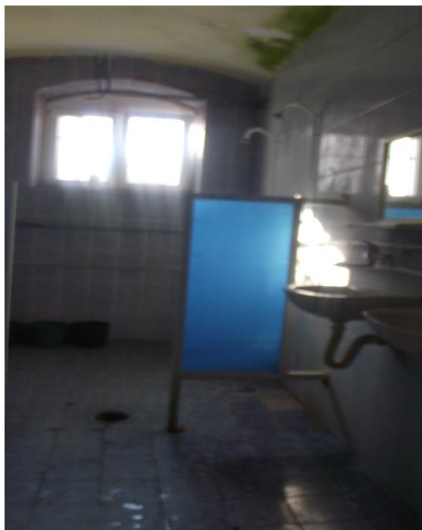
санитарни чвор у спаваоници затвореног одељења и заједничко купатило у полуотвореном одељењу