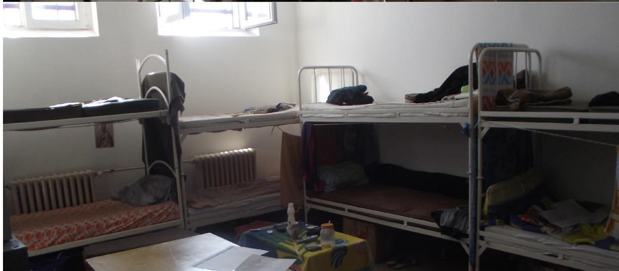
кревети и лежајеви у спаваоницама затвореног одељења